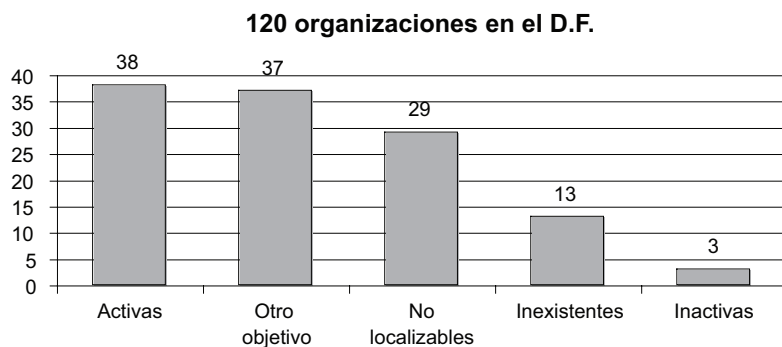
Gráfica 1 Universo de organizaciones del VIH-SIDA en el Distrito Federal

Así, son 38 las OC mexicanas dedicadas exclusivamente o principalmente al trabajo en VIH-SIDA en el Distrito Federal activas y localizables en 2006.